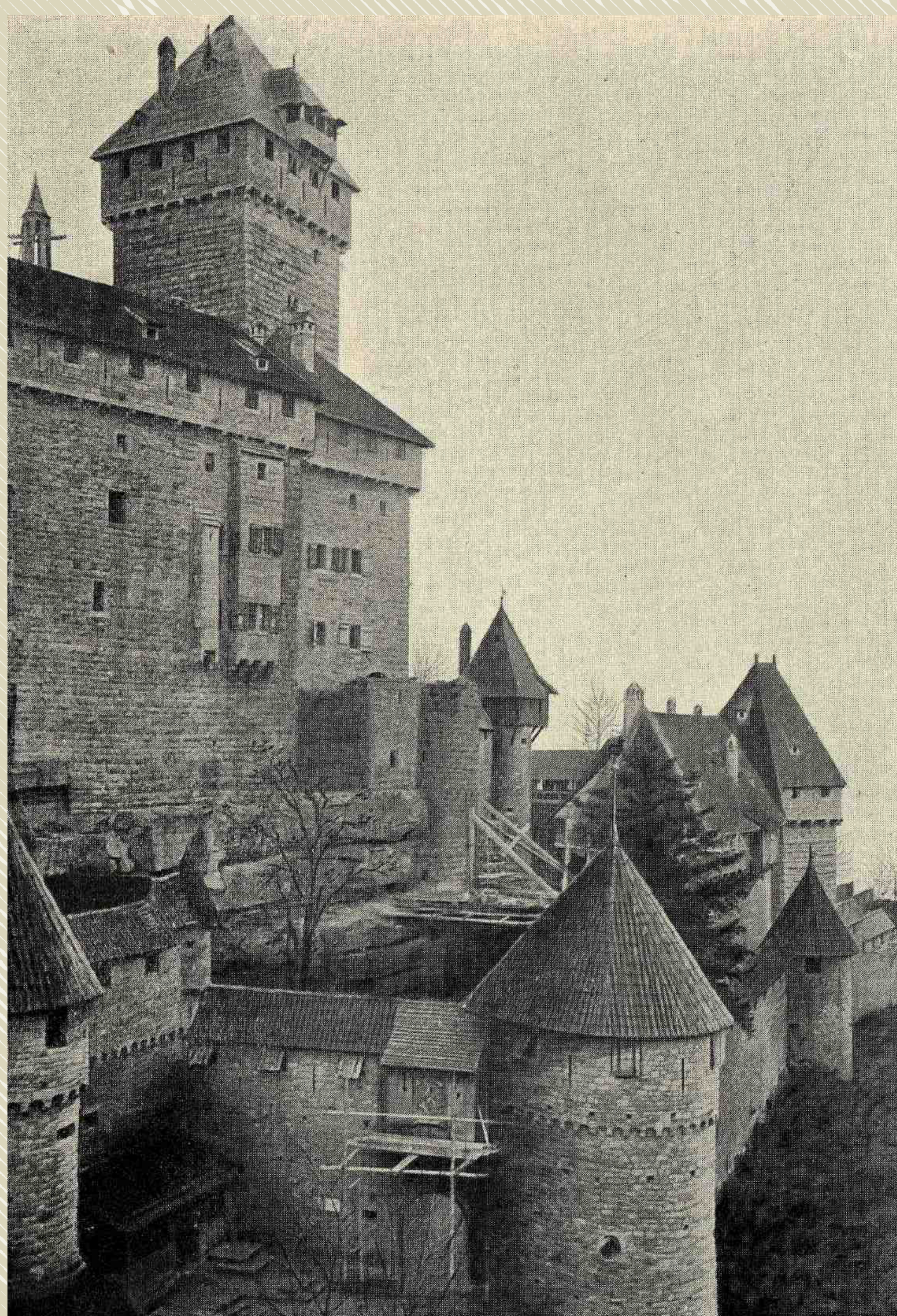
Album photographique avant et pendant les travaux de restauration: Bilder von der Hohkoenigsburg , den Mitgliedern des Hohkoenigsburgs-vereins, 1906. Vue sur le château, côté Est.

Guillaume II, soucieux de rappeler l'appartenance de la région à l'aire germanique, souhaite marquer symboliquement la limite occidentale de l'Empire. Il opte pour une restauration complète du château fort du Haut-Koenigsbourg, cédé par la ville de Sélestat en 1899. L'Empereur souhaite reconstruire la forteresse telle qu'elle se dressait à la fin du XV e siècle, et confie les travaux à l'architecte-historien Bodo Ebhardt. La restauration (1900-1908) est menée dans le goût médiéval alors en vogue, dont la reconstruction de Carcassonne, par Viollet-le-Duc, est un autre exemple.