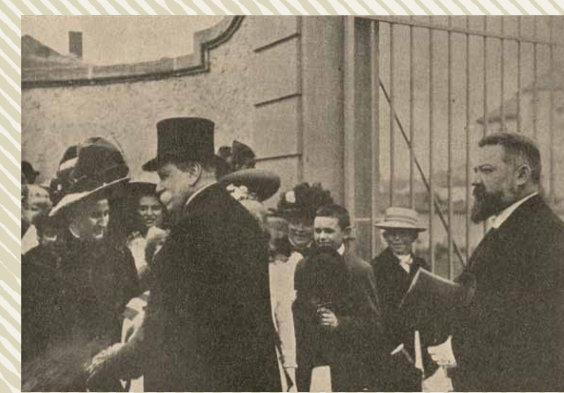
L'inauguration de la nouvelle école normale de filles à Montigny par le Statthalter, 19 juin 1911. Photographie Jacobi parue dans la Croix de Lorraine, 25 juin 1911. ADM 1 AL 42/79.