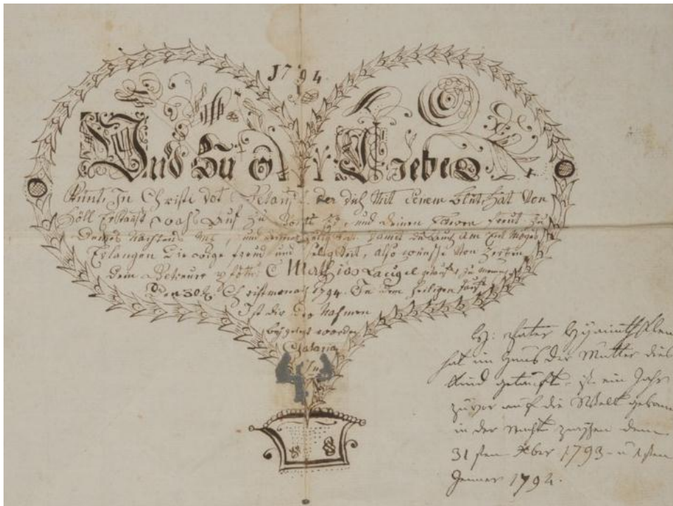
ADBR 3 E 301/3 Pattenbrief, ou lettre de baptême, trouvée dans le registre paroissial catholique de Mommenheim.