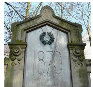
Monument aux morts de Strasbourg, 1874, jardin de l'école des arts décoratifs.