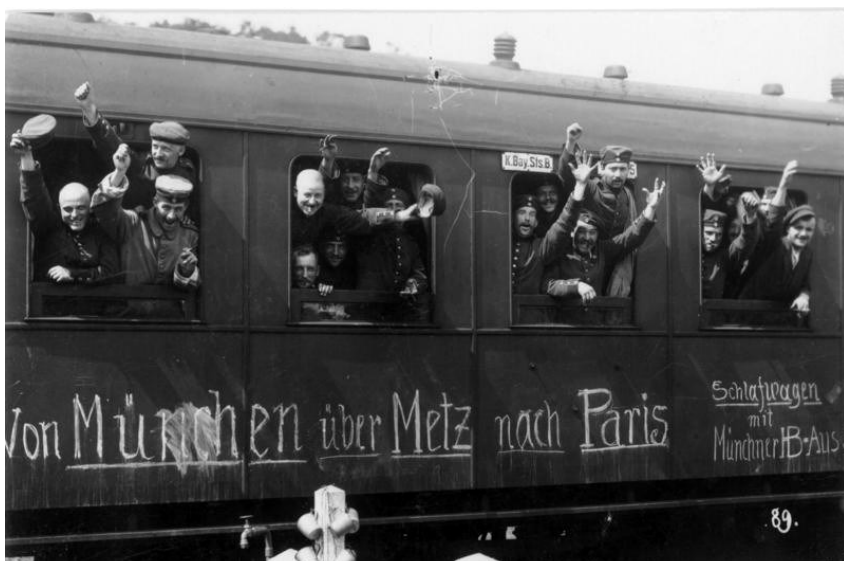
August 1914

Téléchargé le 12/11/2013 sur Wikimedia Commons. Reproduction libre de droits.