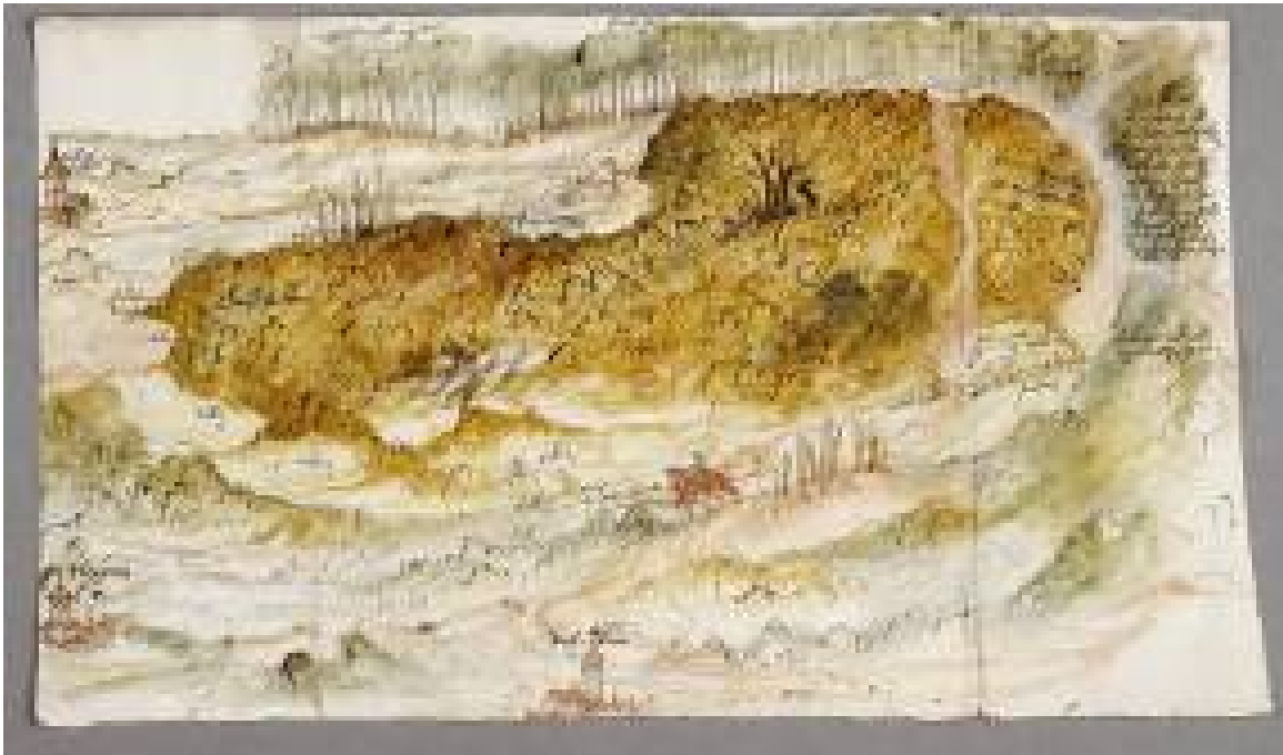
3 B 1093/28 : Plan de la forêt de Balbronn et de Still. 1551.

Histoire des paysages : conflits de propriété, développement des transports, notamment du chemin de fer, etc.