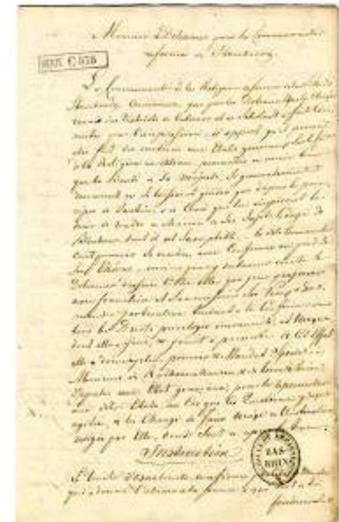
C 575/102 : Mémoire des doléances pour la communauté réformée de Strasbourg, envoyé à Versailles en mai 1789.

Histoire événementielle, à partir d'exemples locaux : la Révolution française, le Front Populaire, etc.