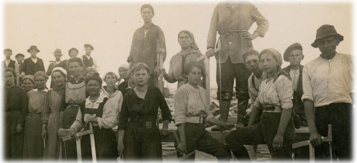
Les ouvrières d'un dépôt militaire à l'arrière du front

Où chercher l'information ? → Chapitre 5 : les femmes et les enfants