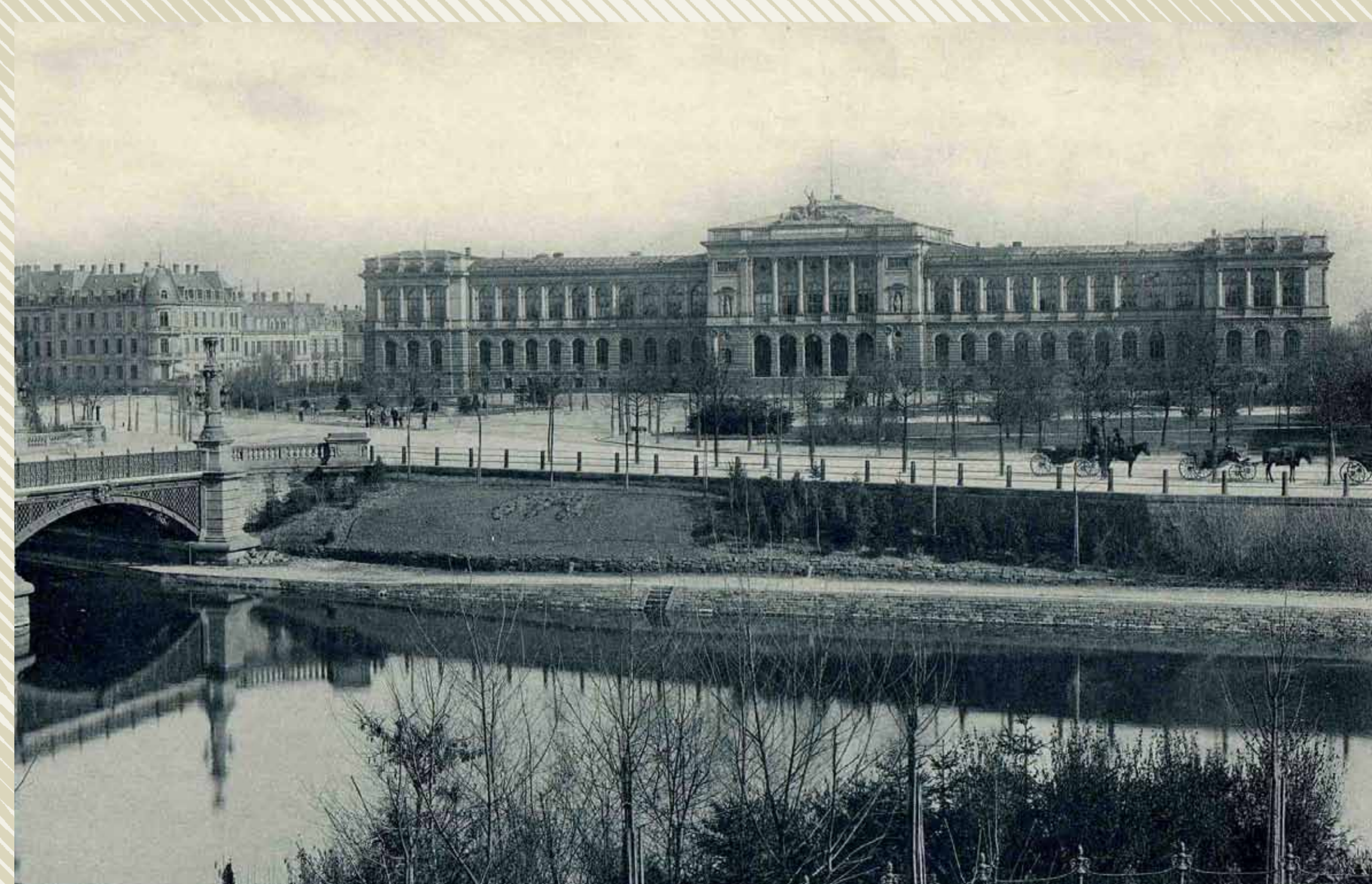
L'université impériale vers 1910. ADBR 1 Fi 7/365.