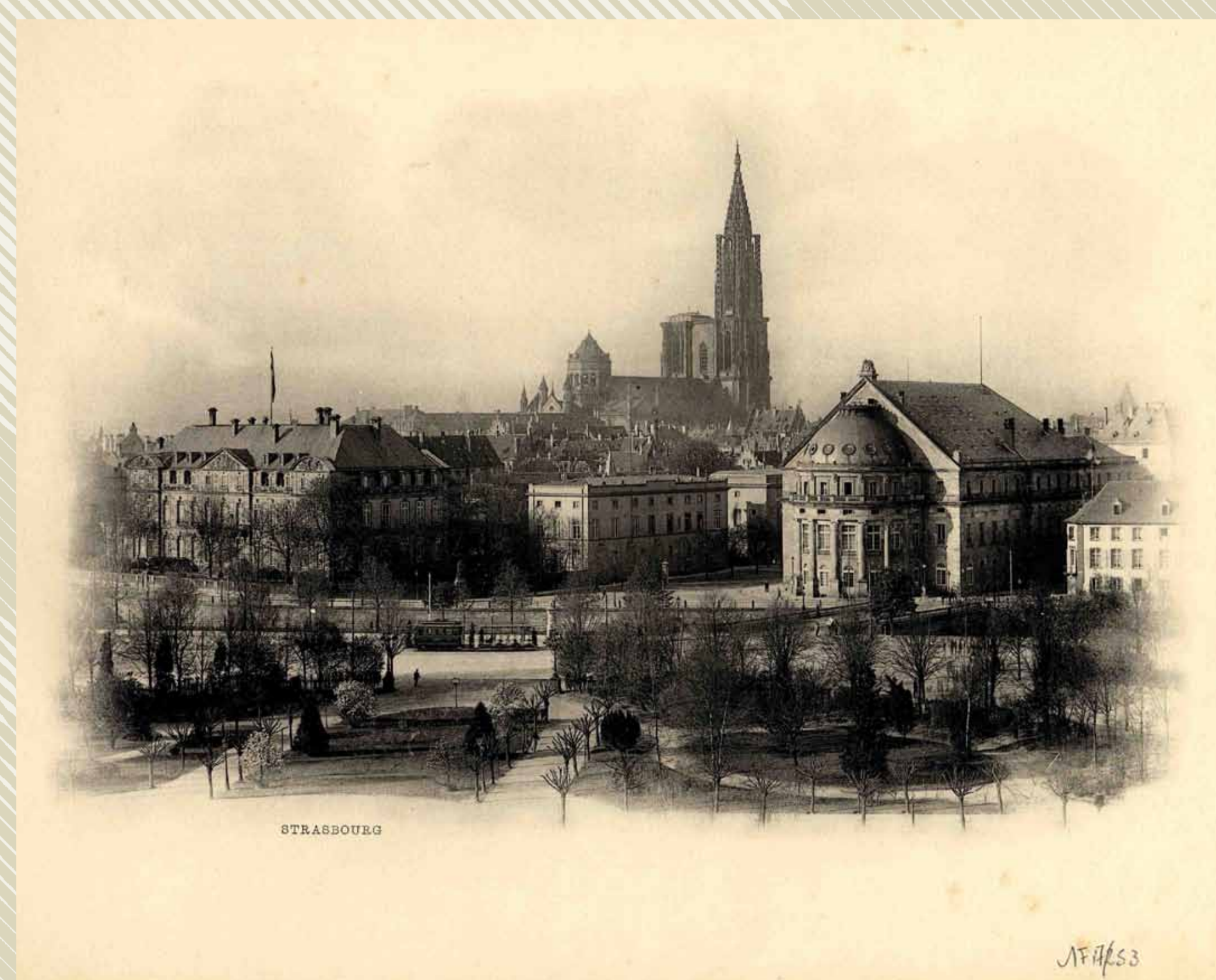
Le « vieux Strasbourg », photographié depuis la Place impériale. A gauche, l'ancienne préfecture, le palais du Statthalter ; à droite, le théâtre municipal. En avant-plan, le tramway à cheval, dont les premières lignes circulent dès 1878.