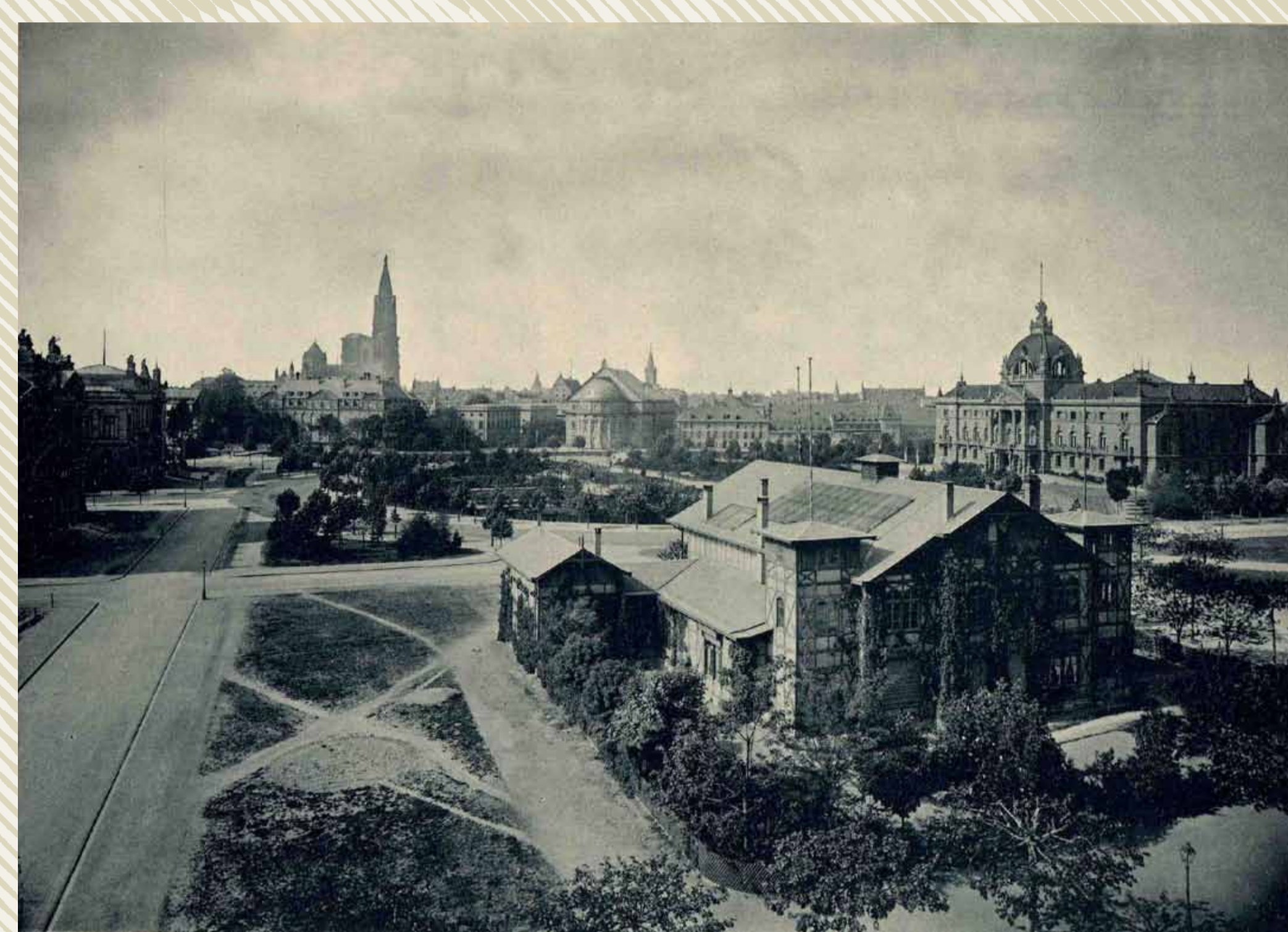
La Place impériale. Au premier plan, le bâtiment provisoire de la Délégation ( Landesausschuss ). ADBR 1 Fi 7 / 366.