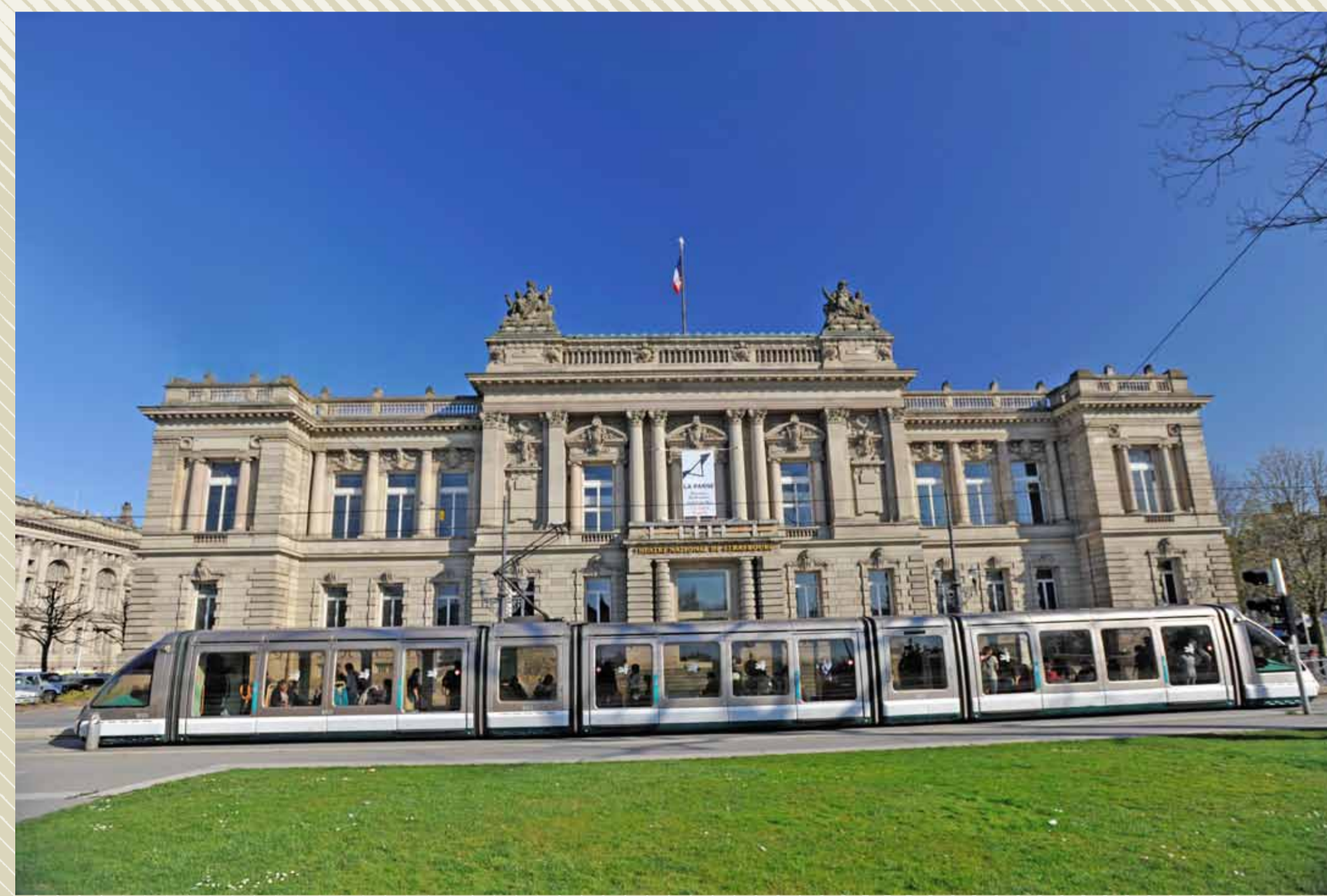
L'ancien bâtiment de la Délégation et du Landtag , partiellement reconstruit après 1944. Il abrite aujourd'hui le Théâtre national de Strasbourg. Sur son fronton, les statues allégoriques de l'Alsace et de la Lorraine. Le bâtiment est également orné des blasons des villes du Reichsland et célèbre ainsi cette entité administrative nouvelle.