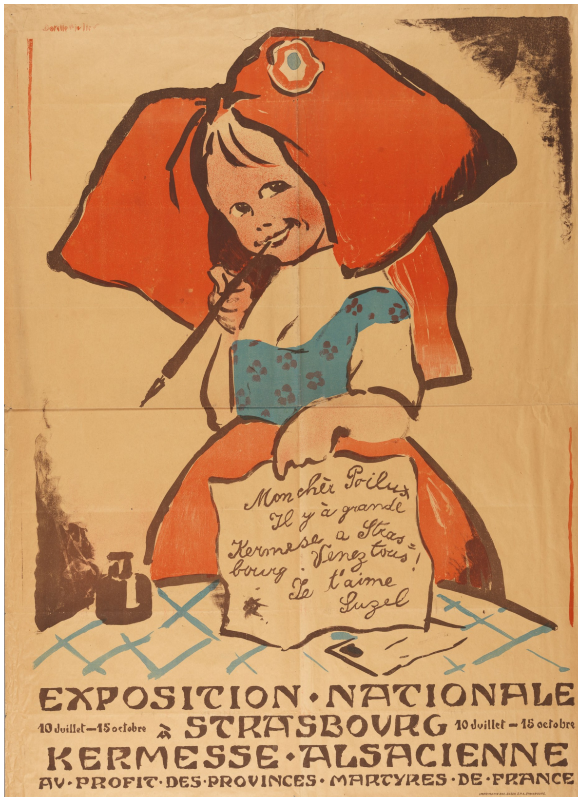
Affiche annonçant une « kermesse alsacienne au profit des provinces martyres de France », à Strasbourg, 1919. Auteur : Dorette Muller. AD67, 1 Fi 153.