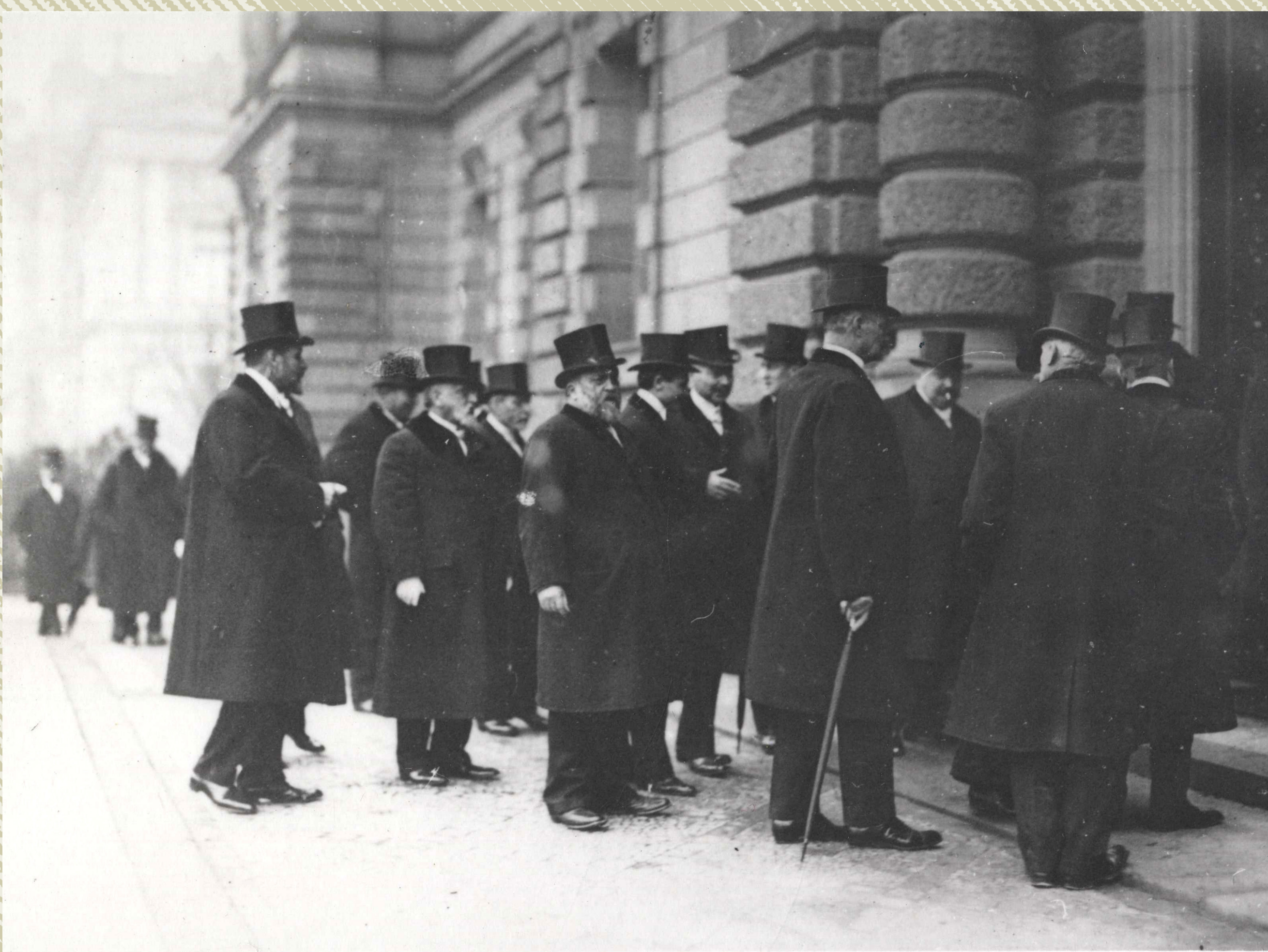
Première rentrée solennelle des députés au Landtag d'Alsace-Lorraine, le 06 décembre 1911. BNU.S.

La lutte pour l'autonomie ne fait en réalité que commencer.