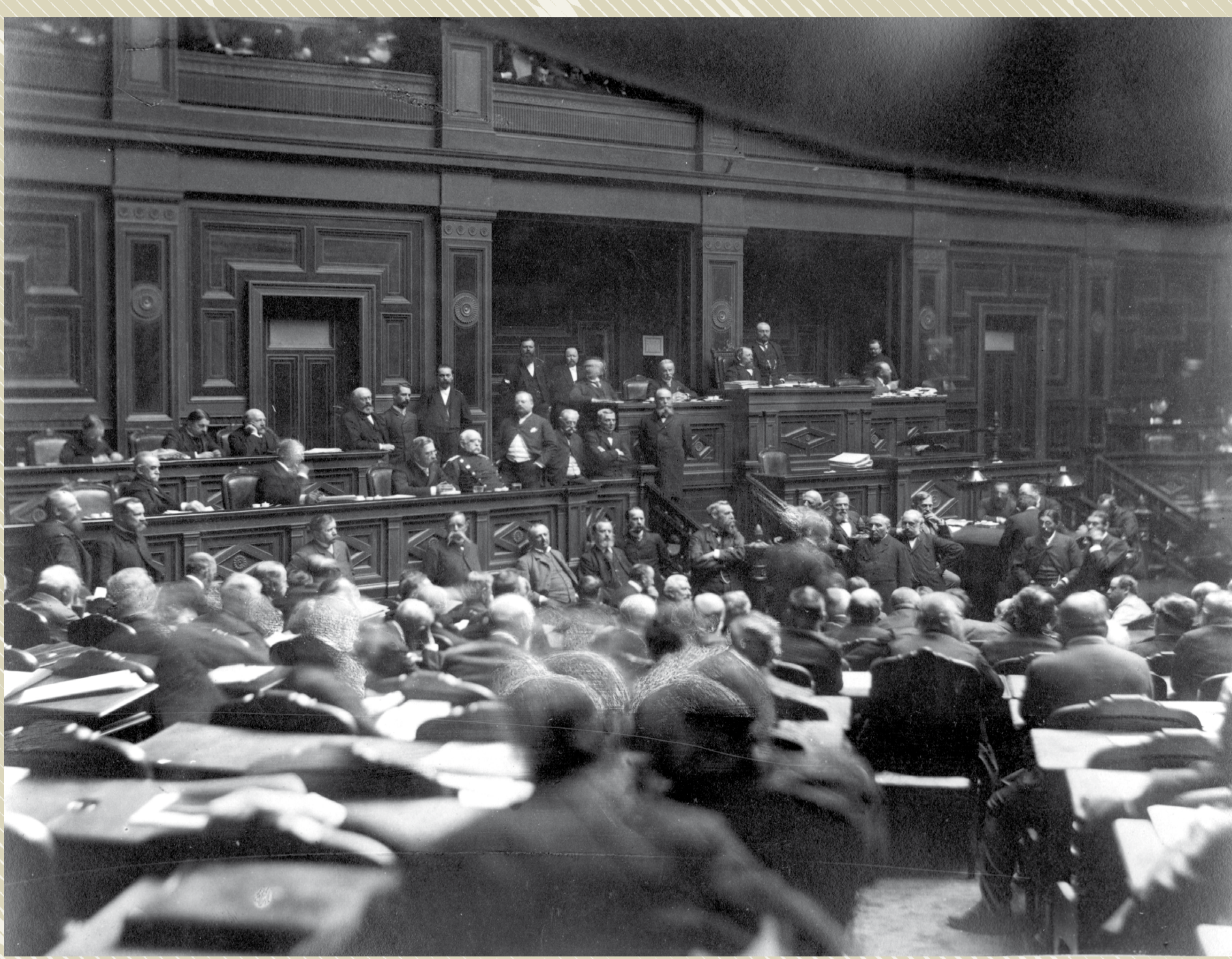
Séance au Reichstag, [vers 1899]. Photographie : Julius Braatz. Bundesarchiv, Bild 147-0973.

Les amendements apportés par le gouvernement qui consent à l'élection d'une Chambre du Landtag au suffrage universel direct trouvent un accueil plus favorable et, le 26 mai 1911, le projet définitif est adopté par le Reichstag par 212 voix contre 94. Dans cette majorité confortable, seuls quatre députés d'Alsace-Lorraine (sur 25 ) ont voté pour le texte : le socialiste Böhle, le conservateur Hoeffel, le libéral Grégoire et le centriste Vonderscheer. Le vote ne rend que très peu compte de la diversité des positions.