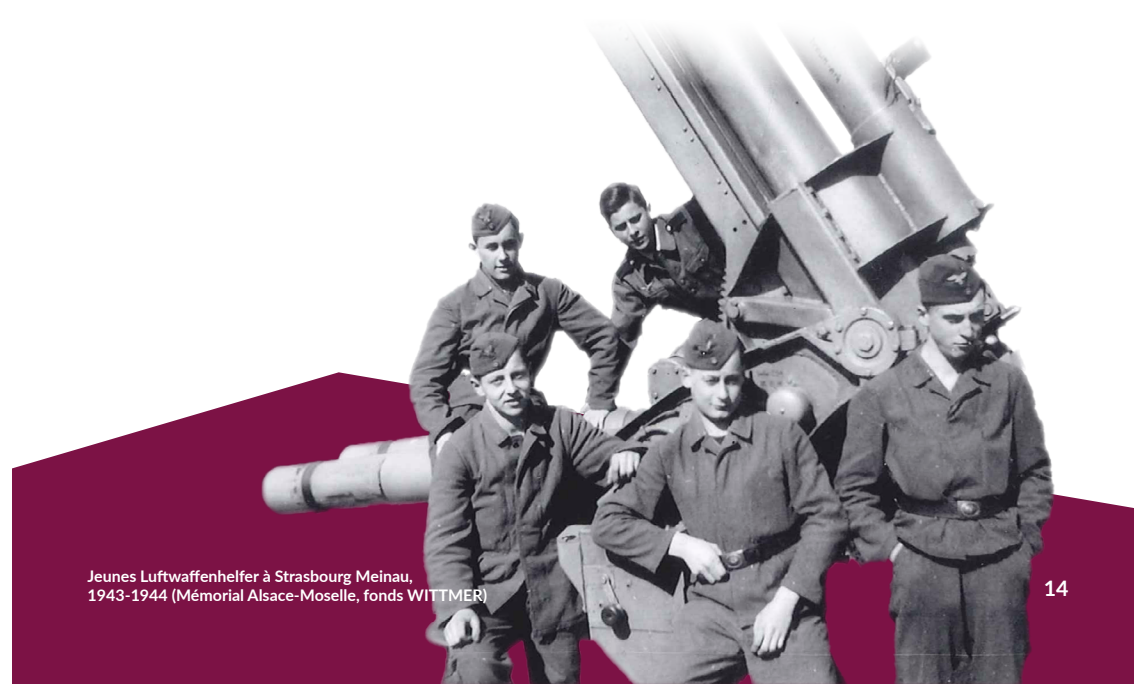
Jeunes Luftwaffenhelfer à Strasbourg Meinau, 1943-1944