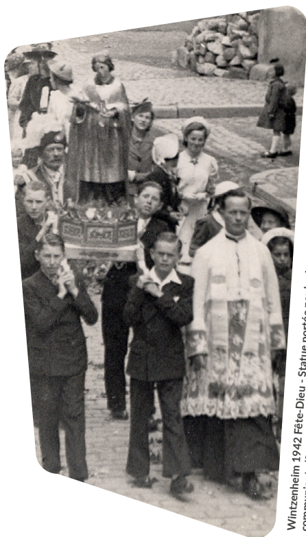
Wintzenheim 1942 Fête-Dieu - Statue portée par les jeunes communiants

Modération : Hervé de Chalendar, journaliste à Saisons d'Alsace , magazine édité par les DNA et L'Alsace .