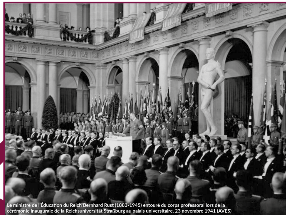
Le ministre de l'Éducation du Reich Bernhard Rust (1883-1945) entouré du corps professoral lors de la cérémonie inaugurale de la Reichsuniversität Straßburg au palais universitaire, 23 novembre 1941