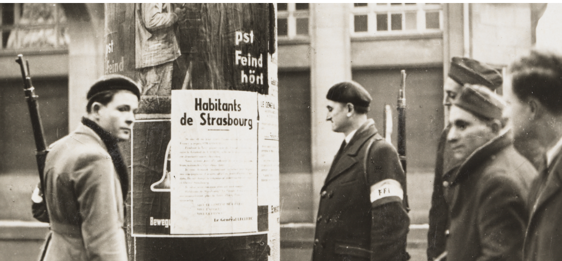
FFI lisant un appel du général Leclerc à Strasbourg en novembre 1944

Salle « Wihr » à Horbourg-Wihr (rue de Fortschwihr)