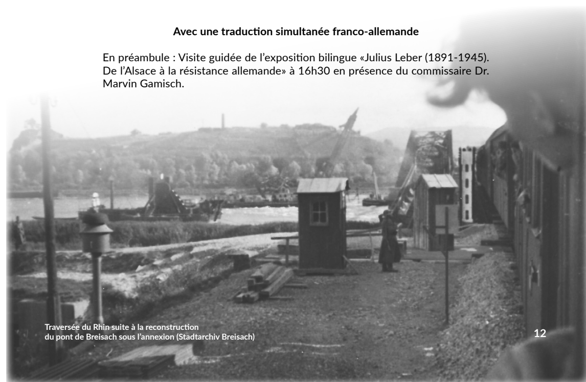
Traversée du Rhin suite à la reconstruction du pont de Breisach sous l'annexion

En préambule : Visite guidée de l'exposition bilingue « Julius Leber (1891-1945). De l'Alsace à la résistance allemande » à 16h30 en présence du commissaire Dr. Marvin Gamisch.