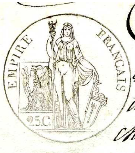
Document n°2. Timbre, 1812, ADBR U 333..