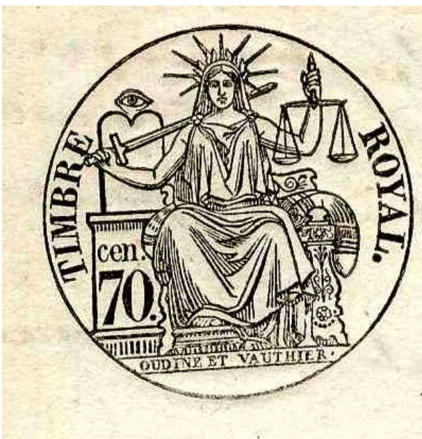
Document n°7. Timbre, 1847, ADBR U 333.