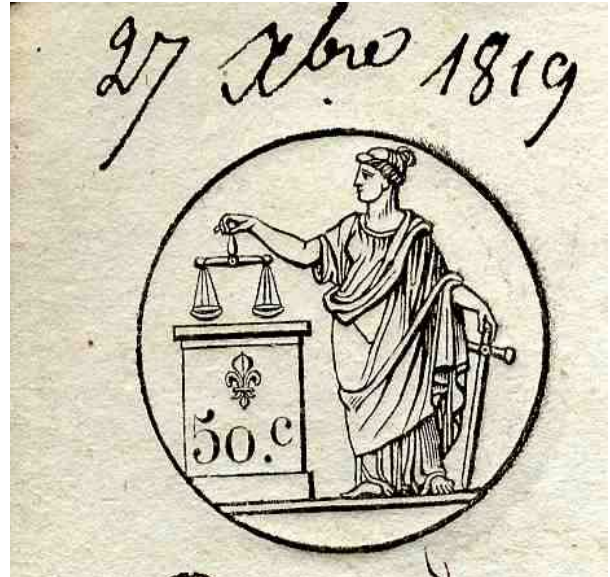
Document n°4. Timbre, 1819, ADBR U 333.