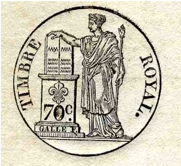
Document n°5. Timbre, 1829, ADBR U 333.