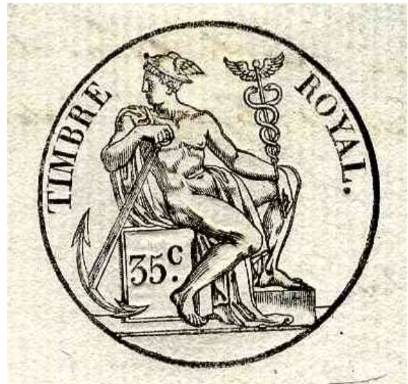
Document n°6. Timbre, 1829, ADBR U 333.