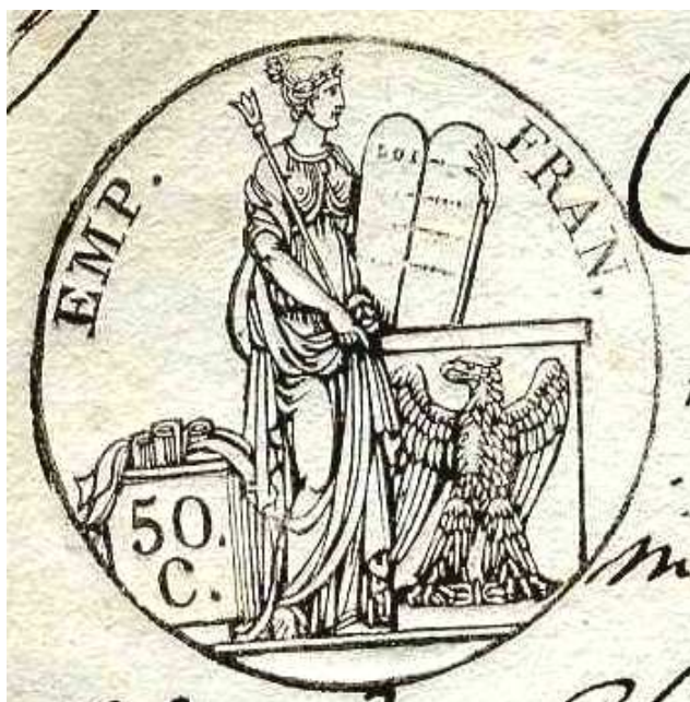
Document n°1. Timbre, 1808, ADBR U 333.