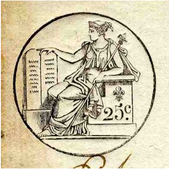
Document n°4. Timbre, 1816, ADBR U 333.