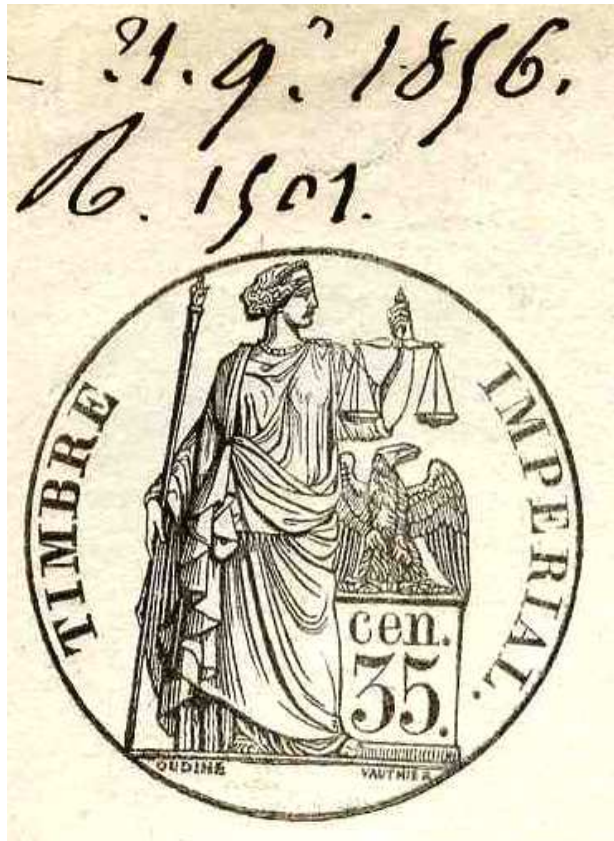
Document n°9. Timbre, 1856, ADBR U 333.

Timbres. Source : ADBR U 333. Interrogatoires 1808-1870