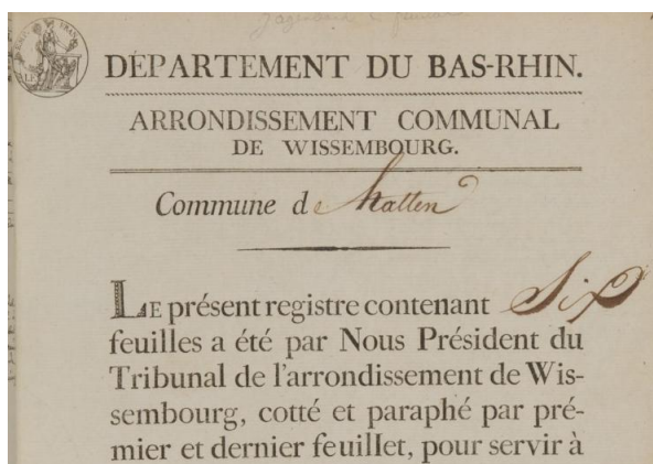
Document 3. ADBR 5 E 544/2