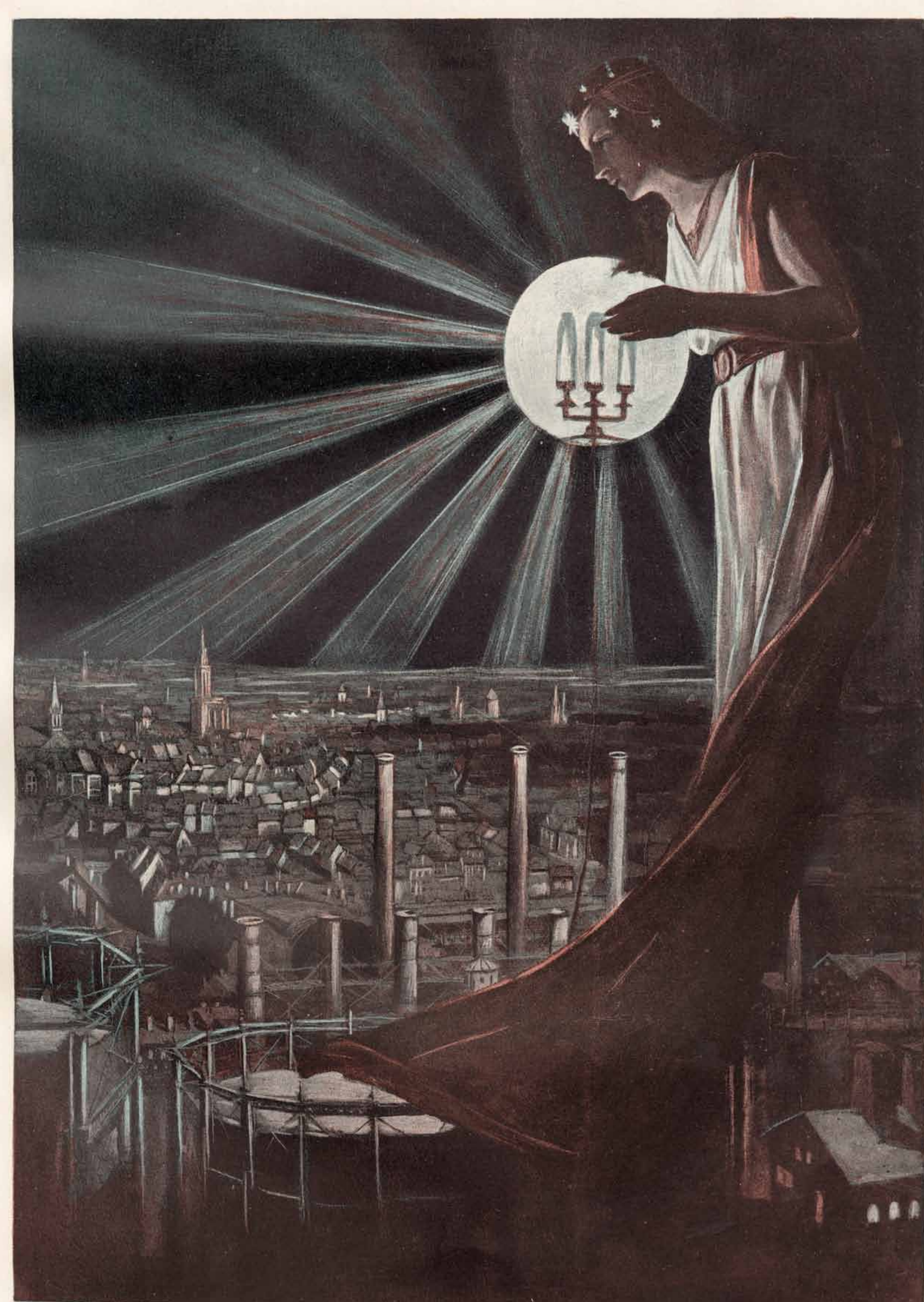
LA REINE DE LA NUIT

La reine de nuit. Gaston KERN, Histoire de l'éclairage à Strasbourg : depuis son origine jusqu'à nos jours, Imprimerie alsacienne, Strasbourg, 1909.